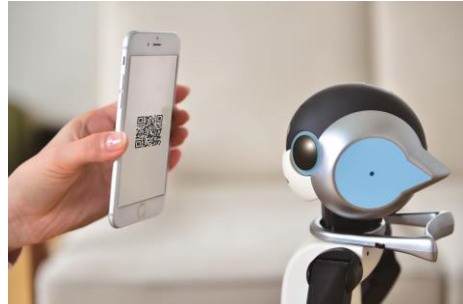
「QRコード読み取り」イメージ